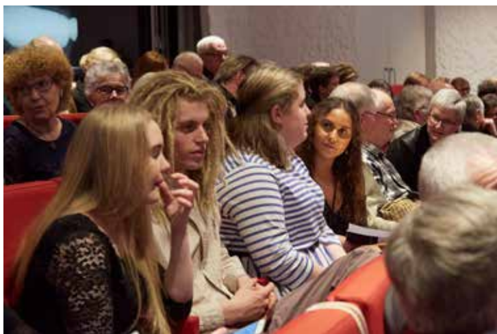
En stor gruppe gymnasieelever var med i projektet.

dagogen, docent Susanna Eken samt mig selv. Vores opgave er at blindlytte alle tilmeldte sangere,