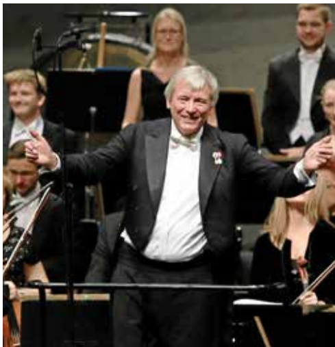
Mihael Schönwandt er igen 1. gæstedirigent.

Orkestret laver skriftlig evaluering af alle nye dirigenter. Alle medlemmer beskriver i et spørgeskema deres oplevelse, og det er afgørende for, om dirigenten