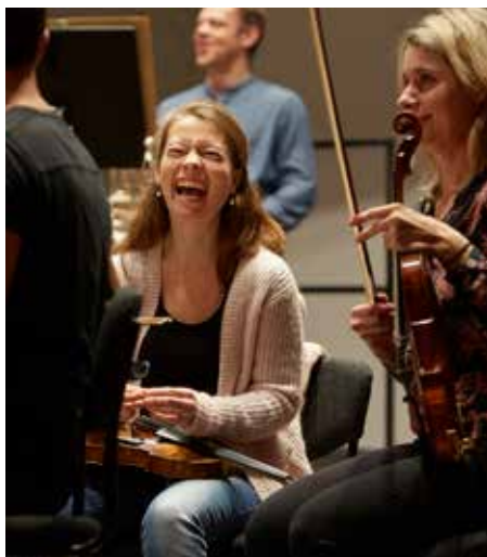
Det var en kraftanstrengelse for orkestret - men også sjovt.

Lige fra vi havde den første LMISC i 2010, har alle deltagende sangere været enormt glade for