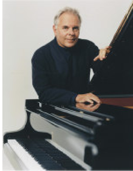
Stephen Kovacevich, solist i Brahms' klaverkoncert nr. 1 den 31. marts

Når Aalborg Symfoniorkester den 1. april gæsteoptræder i Radiohusets Koncertsal i København, sker det sandsynligvis for udsolgt hus. Arrangørerne melder om meget stor interesse for koncerten og i skrivende stund er der solgt 1032 af de 1074 udbudte billetter til koncerten. Den overvældende interesse skyldes ikke mindst at Stephen Kovacevich medvirker i koncerten. Den amerikanske solist har via en