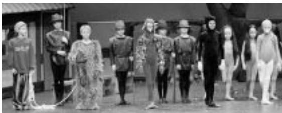
Aalborg Symfoniorkestrets opførelse af Prokofjefs "Peter og Ulven" i efteråret 2006 med balletbørn fra Holstebro Balletskole. Det blev et tilløbsstykke.