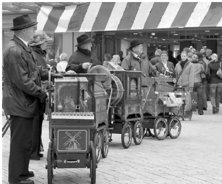
Lirekassemusikanter i Oldenburg

Oldenburg , en smuk by med livlig markedshandel, gøglere på gågaden og forholdsvis velbevaret gammel bycentrum.