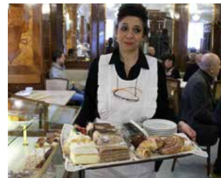
Det er umuligt at overse kagerne til formiddagskaffen i Salzburg.

Scenen er dækket med et tykt lag sand, og orkestret sidder i tre etager ved hesteballetten i Felsenreitschule.