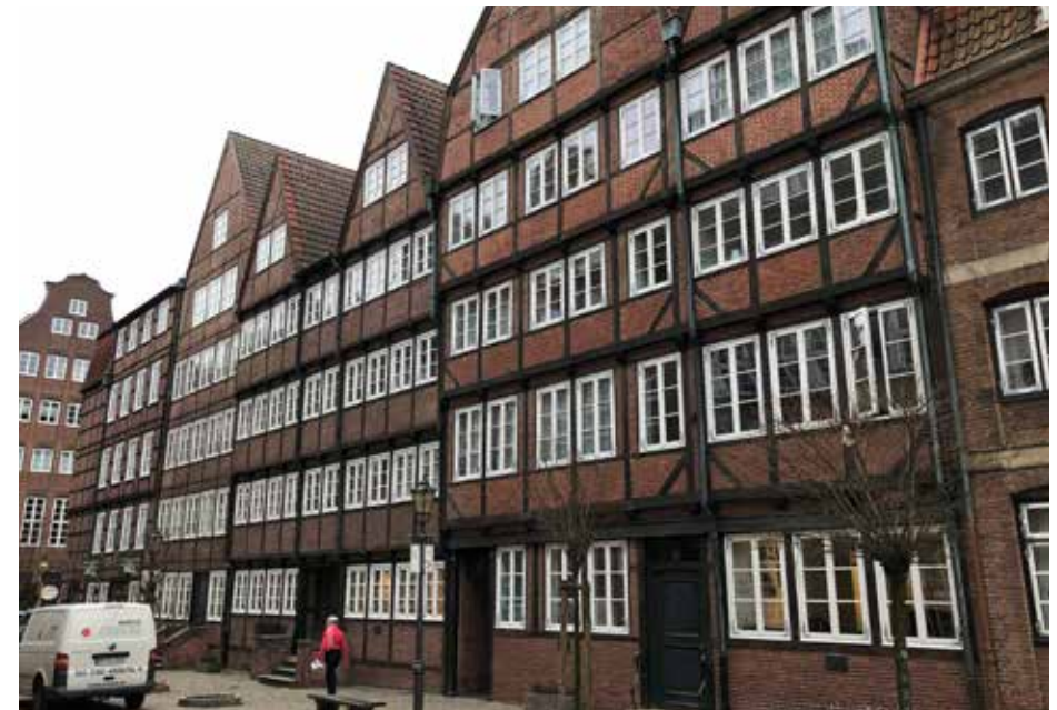
Hele blokken er nu en del af museumskomplekset.

Har man bestemt sig for at tage toget tur-retur til Salzburg, er