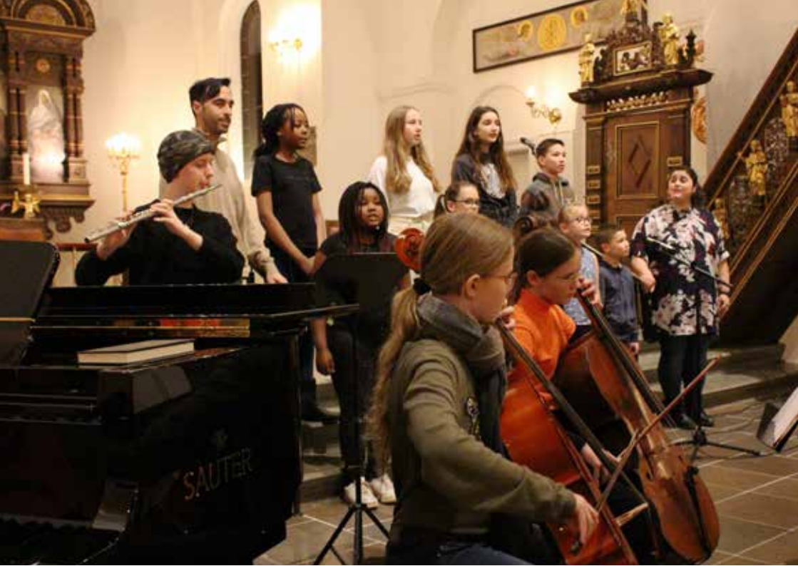
Ved åbningskoncerten i Vor Frue Kirke i Aalborg optrådte de elever, som allerede er kommet så langt, at de kunne danne en lille gruppe.

eller nationalitet. Akademiet skal bare kunne skaffe instrumenter og lærere.