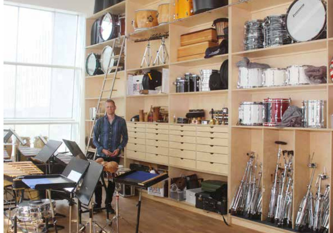
Slagtøjspillernes øverum er fyldt med instrumenter fra gulv til loft.

Det er også vigtigt at spille på rutinen, som giver en fornemmelse af, hvordan jeg skal time min indsats. Hvis jeg udelukkende lytter, komme jeg bagefter, så jeg skal