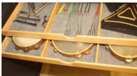
Bag scenen har slagtøjsspillerne også skuffer fulde af udstyr.