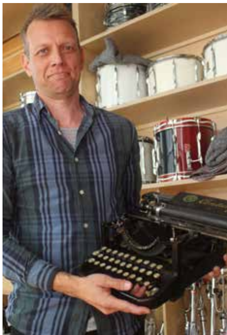
Den gamle skrivemaskine bruges kun i The Typewriter.

Hans mål var en fast stilling i et symfoniorkester, og dem er der