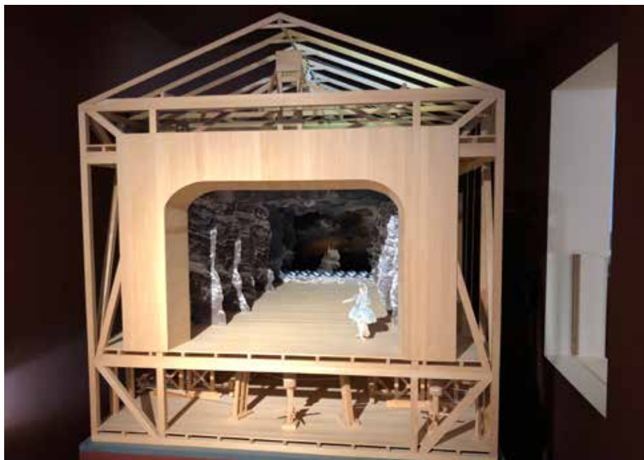
En flot kopi af et gammelt teater fungerer med snoretræk og kulisser.

Hamborg et godt udgangspunkt. Med afgang fra hovedbanegården kl. 10 formiddag og et togskifte i München stiger man af ved 18-tiden i Salzburg. Man kan fouragere i gode madsteder på banegårdene, men der kan også købes mad i toget. 1. klasse-billetter er til at komme i nærheden af, og man sidder nu så behageligt med sin bog, avis, iPad eller (for mit vedkommende) strikketøj - jeg tror ikke, man strikker i Tyskland og Østrig. En venlig togdame kommer forbi og spørger, om man ønsker kaffe eller te.