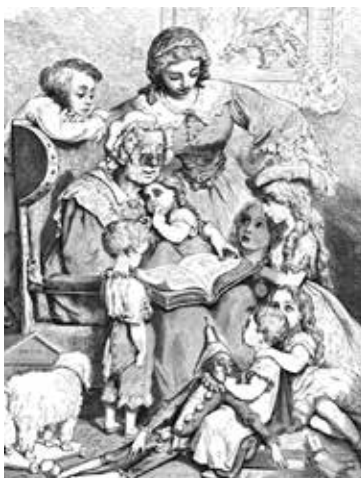
Gåsemor fortæller for børnene. Illustration Gustave Doré.

Og så naturligvis H.C. Andersen. Frankrig kan også være med. Alerede i 1697 udgav Charles Perrault Gåsemors fortællinger, Les contes de ma mère l'oye. Det var en lille samling folkeeventyr, som han genfortalte i et enkelt sprog. I samlingen indgår f.eks. Rødhætte, Tornerose, Tommeliden, Blåskæg og Den bestøvlede kat.