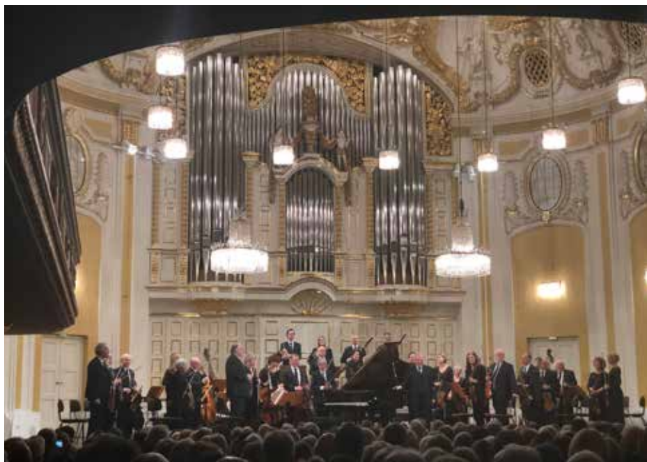
Koncerten med András Schiff og hans Capella Andra Barca i Mozarteums smukke sal er et af højdepunkterne under Mozartwoche.

måske sært. Den gamle rideskole, Felsenreitschule, som var tilknyttet fyrstearkebiskoppens hof i kejsertiden, er den, hvor Familien Trapp synger i "A Sound of Music". Den er hugget ind i klippen, Mönchsberg, og var oprindeligt åben. Den er nu blevet overdækket og fungerer som koncertsal. Vi har overværet en meget æstetisk smuk hesteballet koreograferet til Mozarts Requiem, hvor Marc Minkowski dirigerede sangere og orkester.