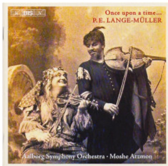
Coveret til ASO's meget roste indspilning af scenemusikken til Drachmanns eventyrkomedie Der var engang